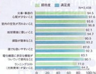
利用前の期待度と利用後の満足度